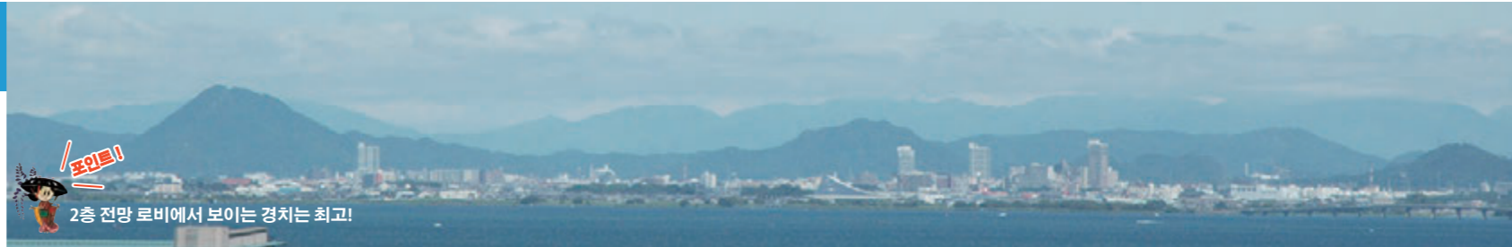
포인트! 2층 전망 로비에서 보이는 경치는 최고!