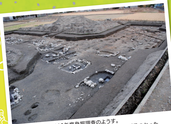
坂本城跡の2019年度発掘調査のようす。中世の町屋を構成する建物、石組土坑や井戸が見つかった。

本企画展では小学生向けのワークシートも用意しています。クイズを解きながら、楽しく展示を見よう！