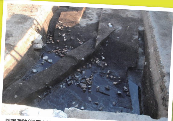
錦織遺跡(細田古墳)の2021年度発掘調査で確認された周濠内のようす。埋没した古墳の周濠内から多数の埴輪片が出土した。