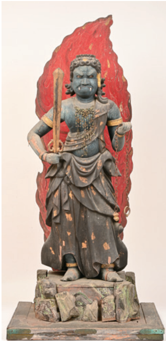
【初公開】不動明王立像 南北朝時代 徳勝寺薬師堂蔵

志賀町は、平成18年（2006）3月に大津市と合併し、令和8年（2026）は合併20周年にあたります。そこで本展では、豊かな歴史を持つ湖西の宗教文化に注目し、この地域に伝来する仏像や神像、仏画、聖教などを展示します。