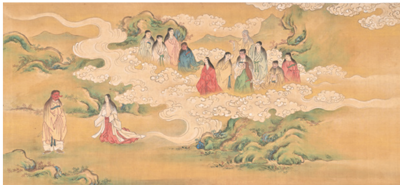
白鬚明神縁起絵巻 江戸時代 白鬚神社蔵