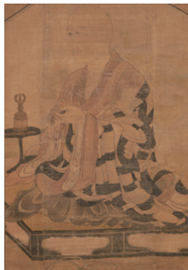
重要文化財 相応和尚像 鎌倉時代 比叡山延暦寺蔵