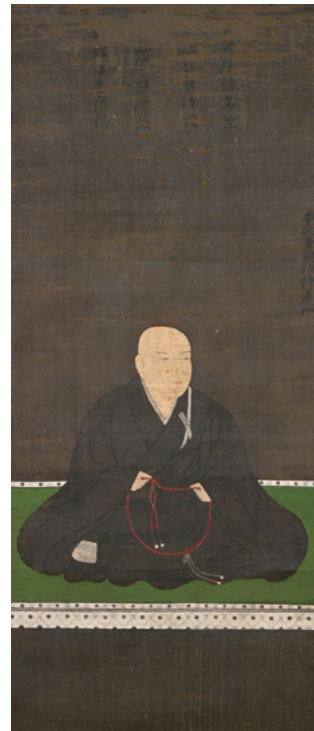
【初公開】蓮如上人像 室町時代 福田寺蔵