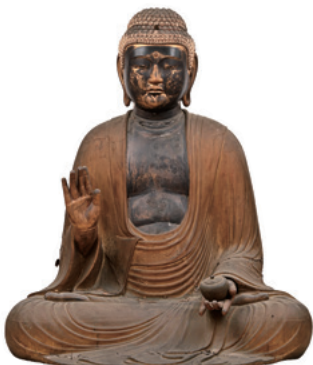
【初公開】薬師如来坐像 江戸時代 薬師堂蔵