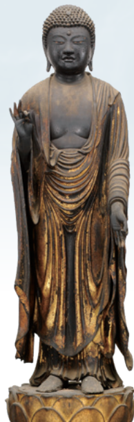
重要文化財 阿弥陀如来立像 鎌倉時代 西岸寺蔵