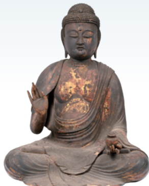
重要文化財 薬師如来坐像 平安時代 長谷寺蔵