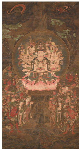
重要文化財 千手観音二十八部衆像 鎌倉時代 大清水蔵