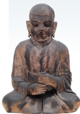
重要文化財 僧形神坐像 平安時代 地主神社蔵